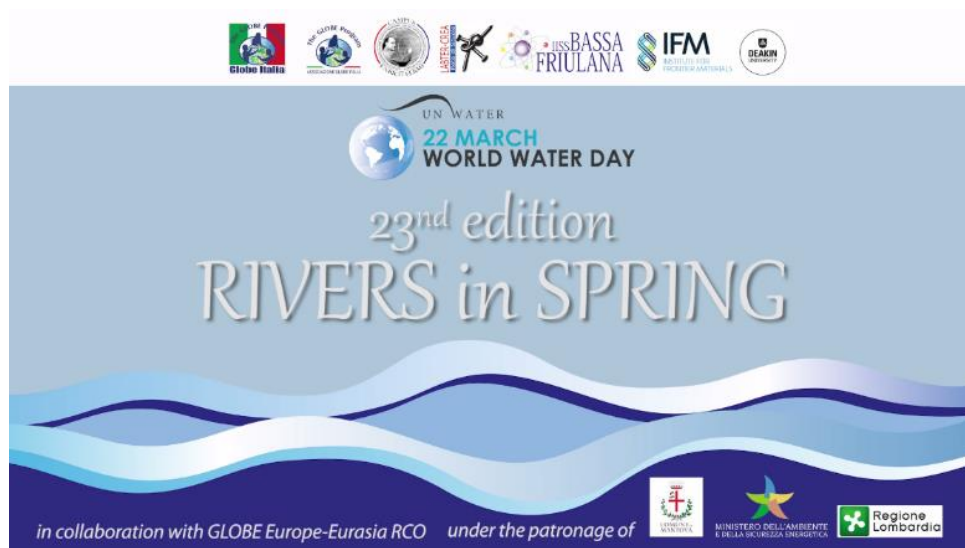
Copertina della edizione Online 2023 di Fiumi di Primavera